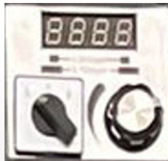
Control de velocidad electrónico