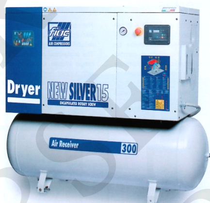
CAS-500 COMPRESOR DE TORNILLO CON SECADOR