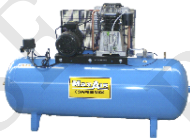
CA-500 Compresor Pistón