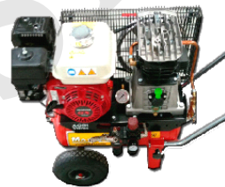
CA-24AGRI Compresor Generador