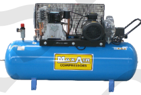
CA-200 Compresor Pistón