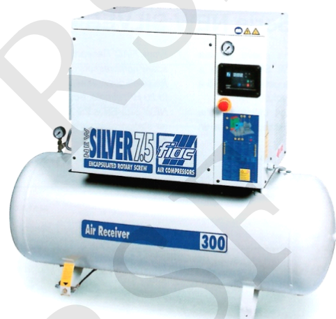
CAT-300 COMPRESOR DE TORNILLO