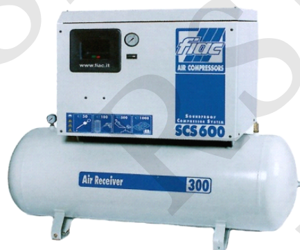
CAI-300 COMPRESOR DE PISTON INSONORIZADO