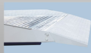
Rampa de acceso ajustable