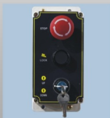
Mando de control y maniobra