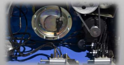
Bombo destalonador y válvulas de pedal de aluminio