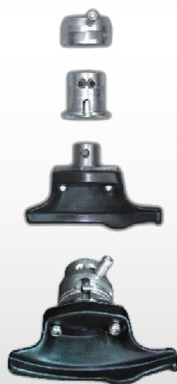
Uña de plástico para llantas de aluminio con enganche rápido