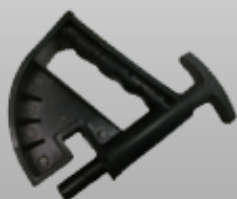
Mordaza par ruedas "Run-Flat"