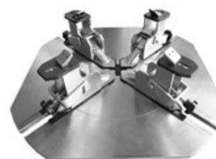
Conjunto de garras para ruedas de moto