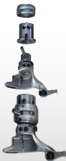
Uña para ruedas de moto con enganche rápido