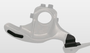
Protectores de plástico para uñas metálicas