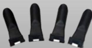
Protectores de plástico para garras