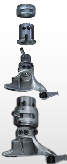
Uña para ruedas de moto con enganche rápido