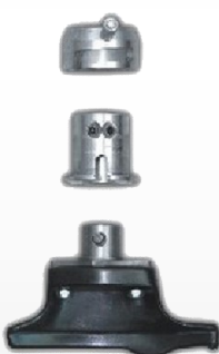
Uña de plástico para llantas de aluminio con enganche rápido