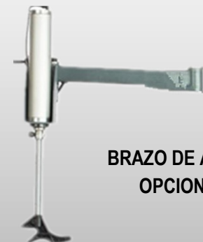
BRAZO DE AYUDA OPCIONAL